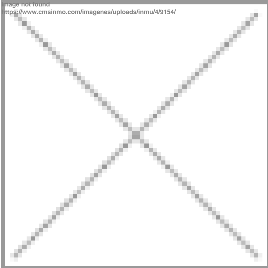
Image not found https://www.cmsinmo.com/imagenes/uploads/inmu/4/9154/